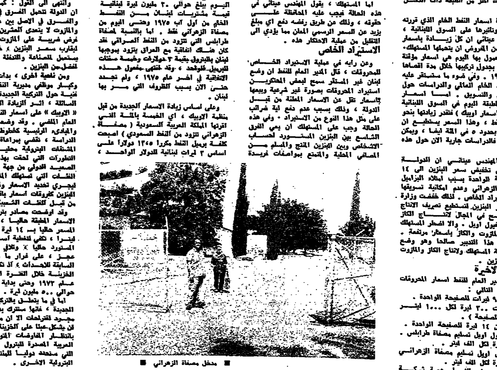
مدخل مصفاة الزهراني

واوضح عيتاني ان العجز في الصندوق اليوم يبلغ حوالي ٢٠ مليون ليرة لبنانية قيمة مشتريات لبنان من النفط الخام من اول آب ١٩٧٥ وحتى اليوم من مصفاة الزهراني فقط . اما بالنسبة لاصفاة طرابلس التي تزود من النفط الصراخي فقد كان هناك اتفاقية مع العراق بتزود بوجها لبنان بطنين بطنين بقيمة ٣٠٠٠٠٠ وخمسة مئنتات النفطية في اضر عام ١٩٧٥ ، ولم تجسد حتى الان بسبب الظروف التي يمر بها لبنان .